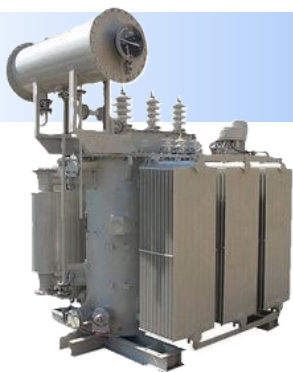
ТМН производства ГК «Alageum Electric»